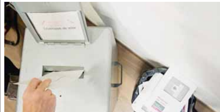
Le prochain scrutin communal devrait se tenir le 23 octobre.